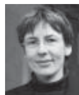
von Prof. Ilse Hartmann-Tews und Dr. Joachim Mrazek

Mit Blick auf die Tätigkeitsfelder erweist sich der Gesundheitsbereich – trotz veränderter gesundheitspolitischer Leitlinien und rechtlicher Rahmenbedingungen – als ein auf quantitativ hohem Niveau stabiles Tätigkeitsfeld. Die Sportvereine und -verbände als die zentralen Organisationseinheiten für den Breitensport wie für den Leistungssport haben sich trotz aller Vermutungen von SportwissenschaftlerInnen über steigende Nachfrage nach professionellen Strukturen nicht einer zunehmenden Verberuflichung des Mitarbeiterstabes geöffnet. Die explizite und implizite Orientierung an einer traditionsbewussten Vereinskultur stellt ganz offensichtlich eine Barriere für die Schaffung von Erwerbsarbeit dar (vgl. Cachay/Thiel/Meier 1999). Dieser schon in den 70er Jahren analysierte Sachverhalt bleibt auch Ende der 90er Jahre relevant. Ob und wenn ja, in welchem Maße die neuen gesetzlichen Regelungen zu Nebenerwerbstätigkeit und Scheinselbständigkeit in den Sportorganisationen zu einer Neuorientierung führen und eine Umschichtung der zu leistenden Arbeit von freiwilligen/ehrenamtlichen sowie geringfügig beschäftigten Formen in Gang kommt, ist ungewiss und bleibt abzuwarten.